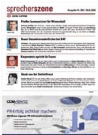
[ SPRECHERSZENE ]