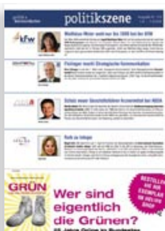
[ POLITIKSZENE ]