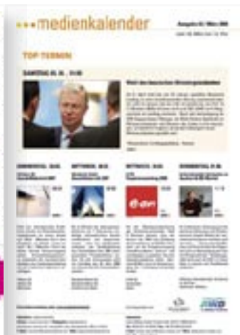
[ MEDIENKALENDER ]