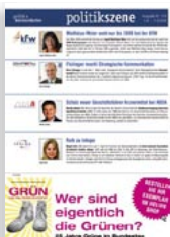
[ POLITIKSZENE ]