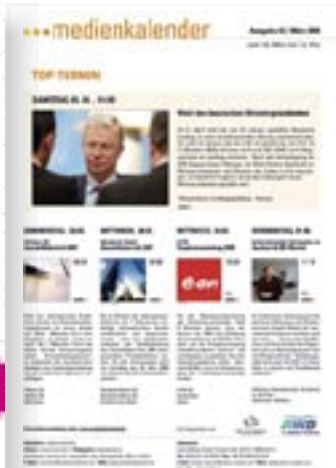
[ MEDIENKALENDER ]