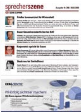
[ SPRECHERSZENE ]